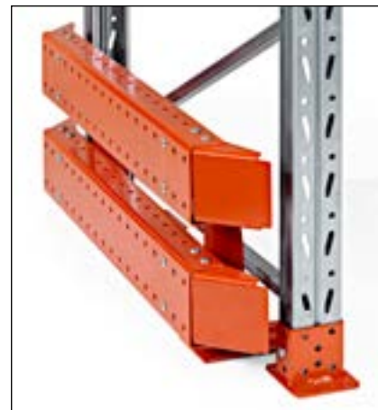
Truckværn højde 400 mm - for ydergavle og truckgennemkørsler. Findes for både enkeltreol och dobbeltreol. Højde 400 mm.