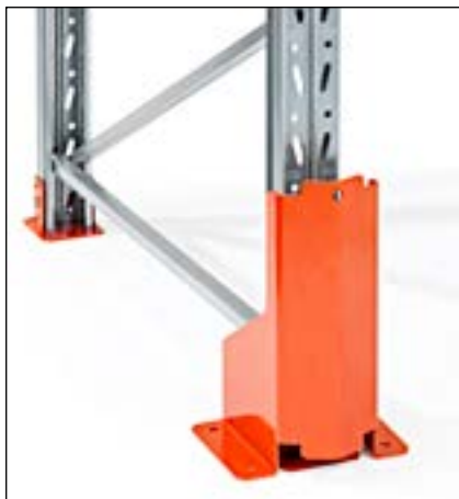
Stolpebeskytter højde 400 mm - for montage i gulv.