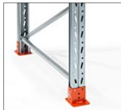
Studs fodplade - giver en meget fin indfæstning i gulv og beskytter stolpens nederste del.