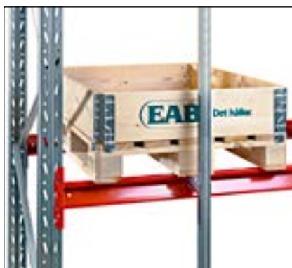
Pallestop vertikalt - monteres i bagkant og forhindrer at pallen skubbes for langt ind.