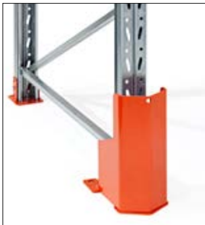
Stolpebeskytter højde 400 mm med PU-fjeder - for montage i gulv. Monteres med PU-fjeder