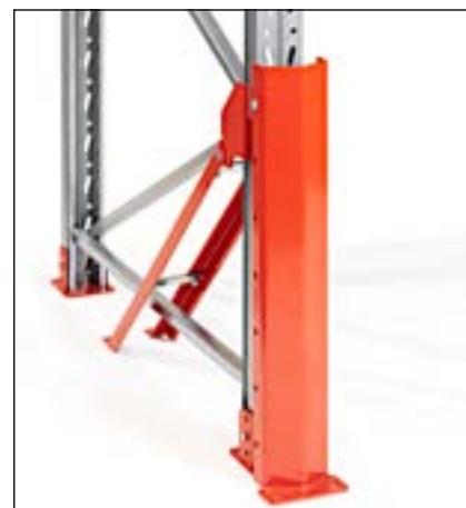
Stolpeforstærkning 90/110 høj front - monteres i stolpen og i gulvet. Kan anvendes i forbindelse med en lavt placeret bærebjælke.