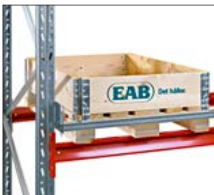
Pallestop horisontalt - monteres i bagkant og forhindrer at pallen skubbes for langt ind.