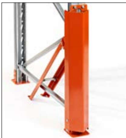
Stolpeforstærkning 90/110 høj - for montage på studs-fodplade. Giver den absolut bedste beskyttelse af den mest udsatte del af stolpen. Højde 760 mm.