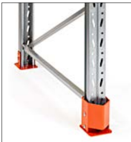
Stolpeforstærkning 90/110 lav - for montage i kombination med studs-fodplade. Beskytter stolpen uden at optage ekstra plads. Højde 150 mm.