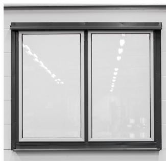
Yderside med pladebeklædning.

Vi ved, at vores porte holder. Derfor medfølger der altid 10 års garanti, uanset hvilken løsning du vælger. Hver port er fremstillet i Smålandsstenar, Sverige, og vi behersker kunsten at kombinere form, funktion og holdbarhed.