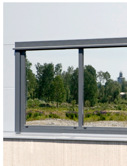
Termovindu med grå beklædning.