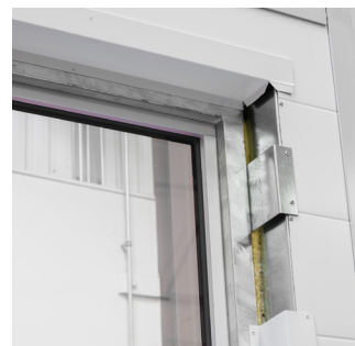
Befæstigelse med pladevinkel.