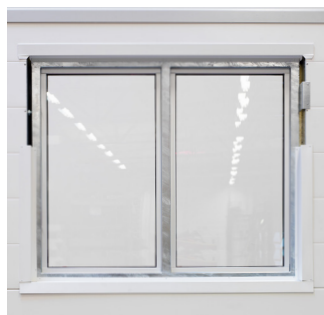
Varmforzinket karm indvendig.