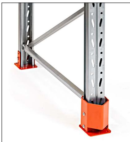
Stolpeforstærkning 90/110 lav - for montage i kombination med studsodplade. Beskytter stolpen uden at optage ekstra plads. Højde 150 mm.