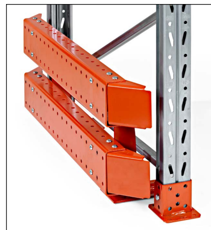
Truckværn højde 400 mm - for ydergavle og truckgennemkørsler. Findes for både enkeltreol och dobbeltreol. Højde 400 mm.