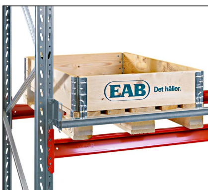
Pallestop horisontalt - monteres i bagkant og forhindrer at pallen skubbes for langt ind.