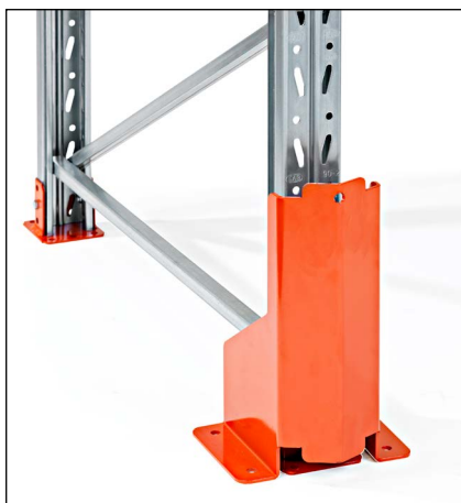
Stolpebeskytter højde 400 mm - for montage i gulv.