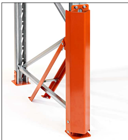
Stolpeforstærkning 90/110 høj - for montage på studsodplade. Giver den absolut bedste beskyttelse af den mest udsatte del af stolpen. Højde 760 mm.