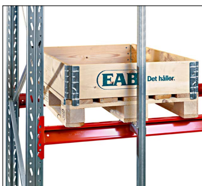
Pallestop vertikalt - monteres i bagkant og forhindrer at pallen skubbes for langt ind.