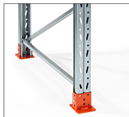
Studsodplade - giver en meget fin indfæstning i gulv og beskytter stolpens nederste del.