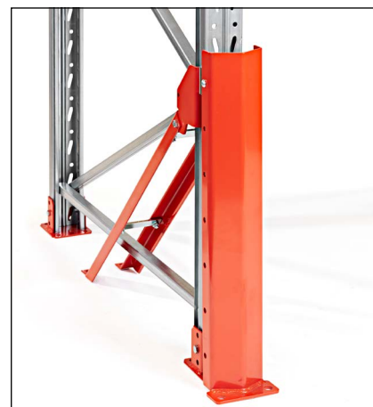
Stolpeforstærkning 90/110 høj front - monteres i stolpen og i gulvet. Kan anvendes i forbindelse med en lavt placeret bærebjælke.