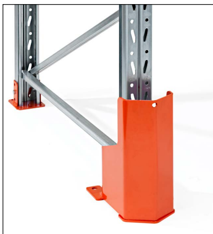
Stolpebeskytter højde 400 mm med PU-fjeder - for montage i gulv. Monteres med PU-fjeder