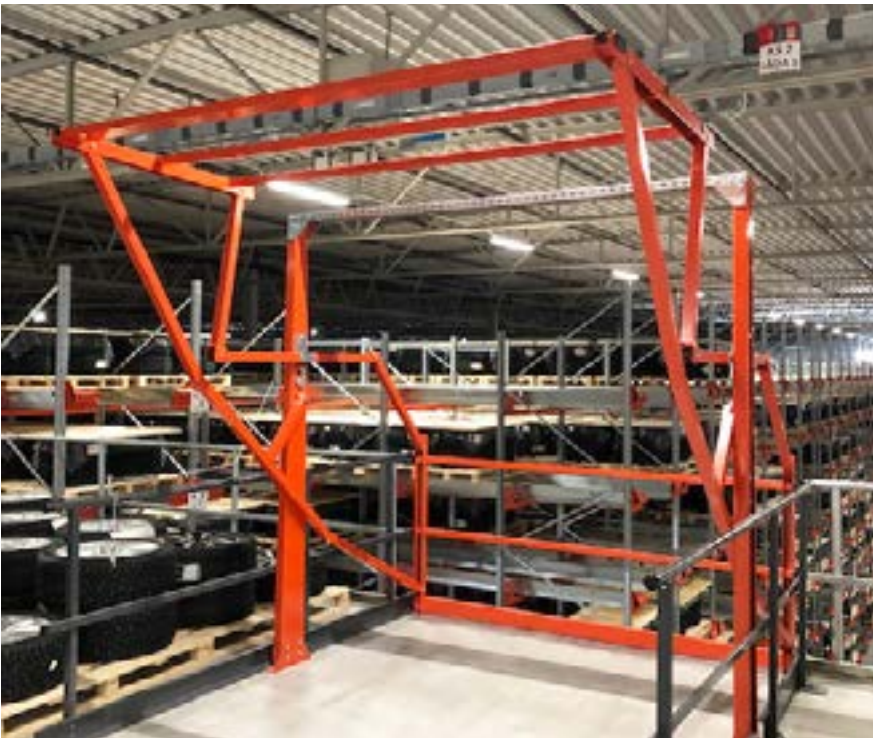
Indlagringsplads med vippelåge

Derfor skal du vælge en mezzanin fra EAB: