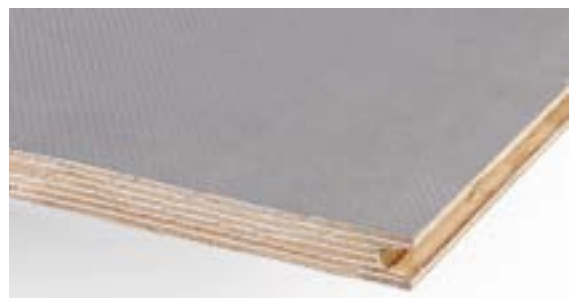
EABs gulvplade af birkeplywood med en slidstærk mønstret overflade af fenolfilm.