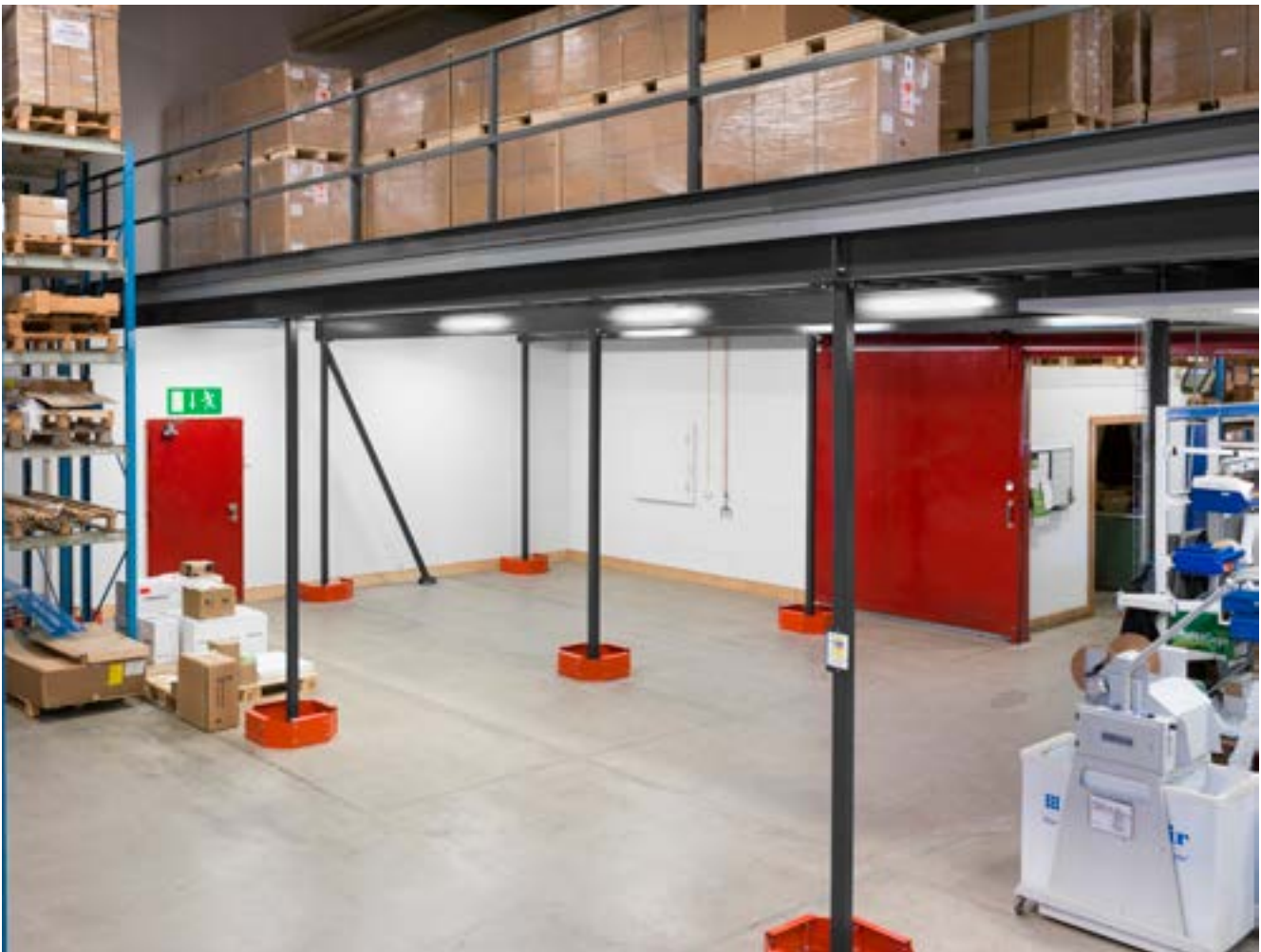
En mezzanin giver en ekstra etage og frigør brugbart gulvareal.