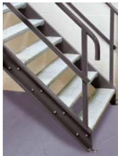
Trappe til mezzaninen med trin i forskellige udførelser.