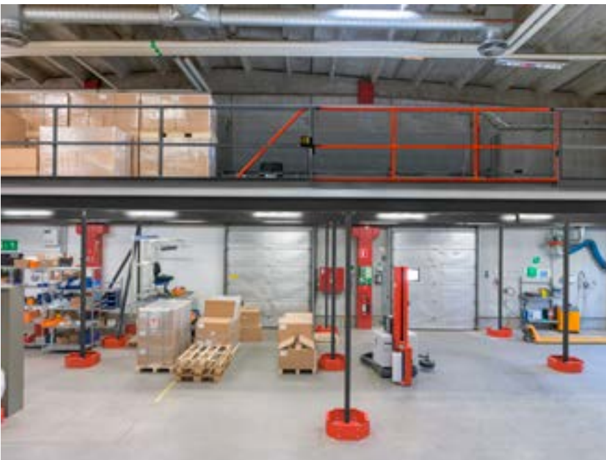
Indlagringsplads med motordreven skydelåge. Manøvreres via radiosender