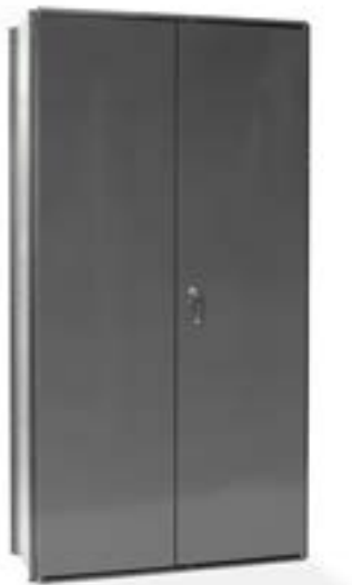
Reol med dørsektion