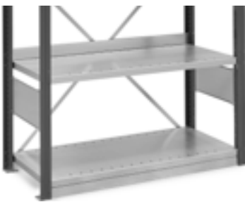
Sokkelplade og bagkant