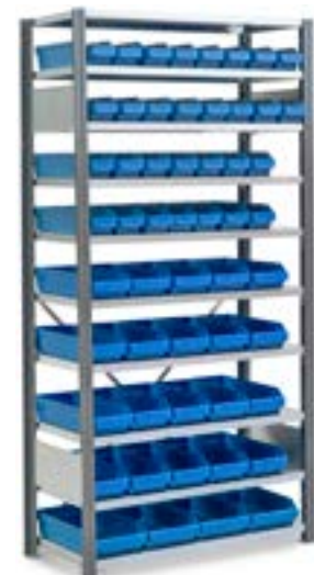
Reol med plukbakker